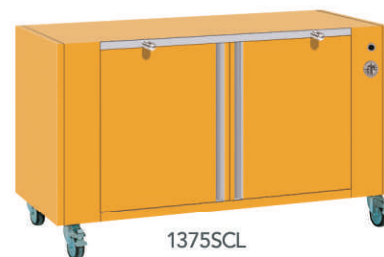
1375SCL + COUL1