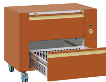
975SBCL + COUL1