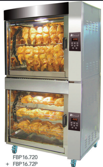
FBP16.720 + FBP16.72P