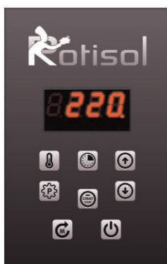
Ecran électronique Digital display