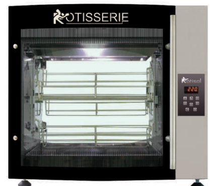
FBP5.520 + FBP520BDE + GLB5520 + FBP.PIED