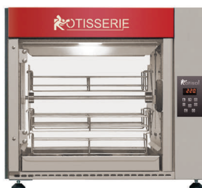
FBP5.520 + FBP520BDE + FBP.PIED