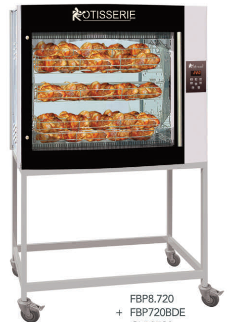
FBP8.720 + FBP720BDE + GLB8720 + FBP8.72PR